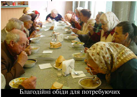
Благодійні обіди для потребуючих

Remember, we are reflecting on Halychyna in 1931!